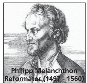
Philipp Melanchthon Reformator (1497 - 1560)